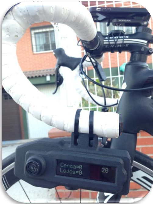
Medidor-contador láser fijado en el manillar de la bicicleta