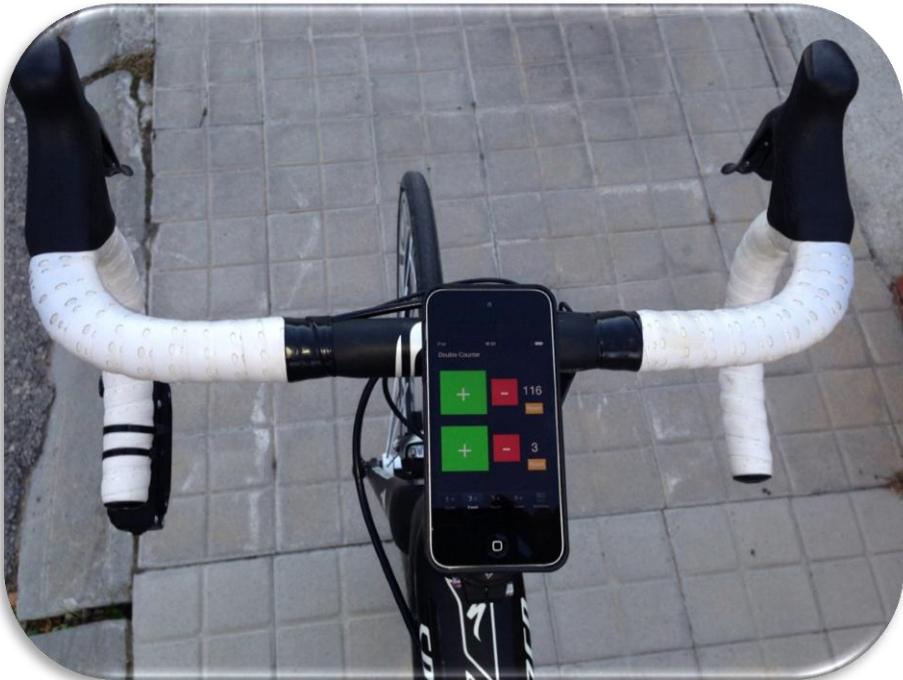
App manual de conteo de adelantamientos y errores